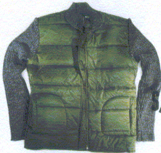
Casaca en nylon con manga y cuello tejido CPB506 antes S/. 179