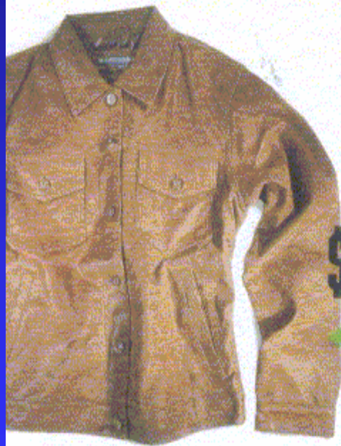
Casaca classic jean de cuero CD307 antes $ 79